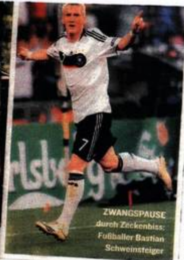
ZWANGSPAUSE durch Zeckenbiss: Fußballer Bastian Schweinsteiger

Klingt recht seltsam. Mag sein, aber Biofeedback wird